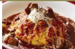
牛肉の煮込みオムライス+ ¥200