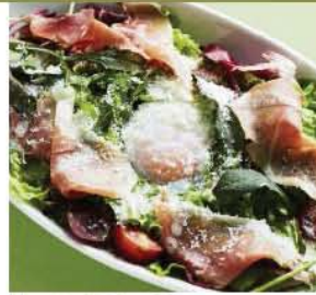
スペイン産生ハムと半熟玉子のシーザーサラダ