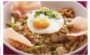
ホエー豚とアスパラの旨塩チャーハン