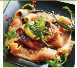
スモークサーモンのカルパッチョ