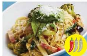
香味野菜のベジチーノ ※生食風味