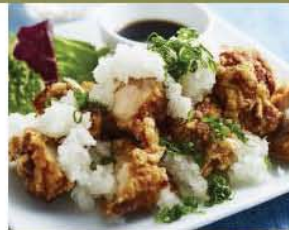
若鶏のから揚げ(おろしポン酢添え)