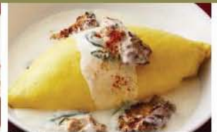
炭焼きチキンとほうれん草のクリームオムライス