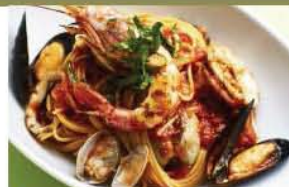
魚介と完熟トマトのペスカトーレ+ ¥100