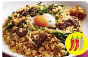
牛カルビと半熟玉子の旨辛チャーハン+ ¥100