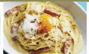
フランス産クリームチーズの濃厚カルボナーラ