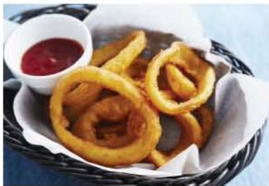
Onion Rings オニオンリング 490