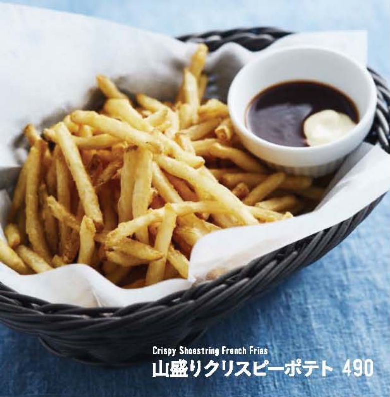
Crispy Shoestring French Fries 山盛りクリスピーポテト 490