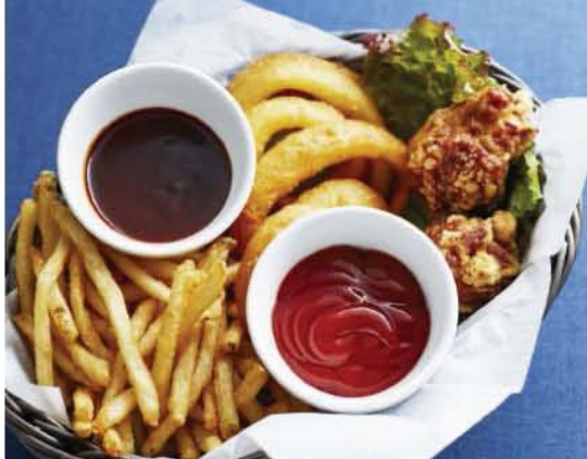
Mixed Fry Basket フライバスケット 690