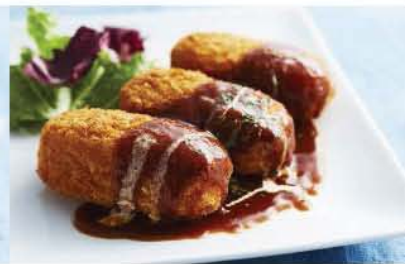
Crab Cream Croquette with Demi-Glace Sauce カニクリームコロッケ (デミグラスソース) 690 ※ご提供に少々お時間を頂きます。