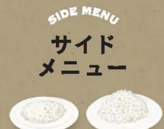
SIDE MENU サイドメニュー ライス ライス大盛り ¥200 ¥300