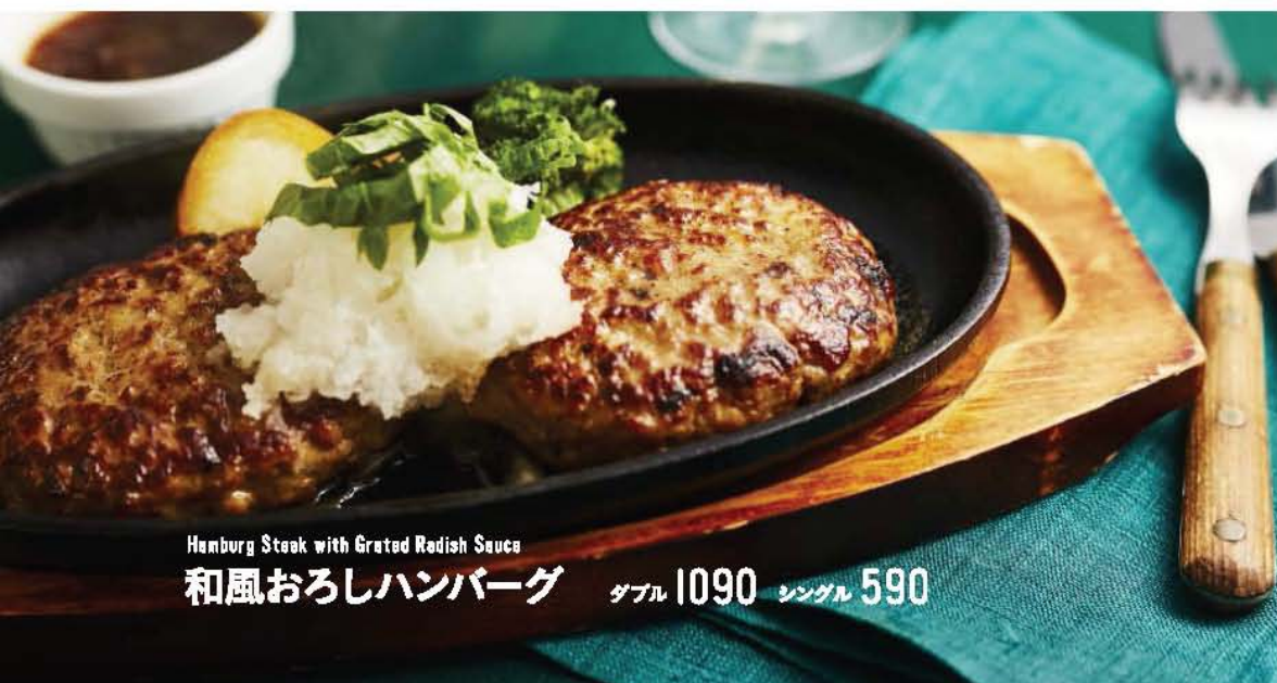
Hamburg Steak with Grated Radish Sauce 和風おろしハンバーグ ダブル 1090 シングル 590