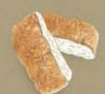
フォカッチャ (2PC) (オリーブオイル添え) ¥250