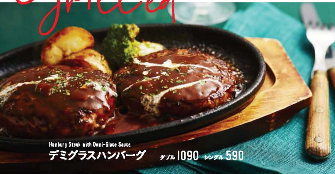
Hamburg Steak with Demi-Glace Sauce デミグラスハンバーグ ダブル 1090 シングル 590

しっかりとしたお肉の粒感が噛むほどにジューシーなハンバーグ。 ※ご提供に少々お時間を頂きます。