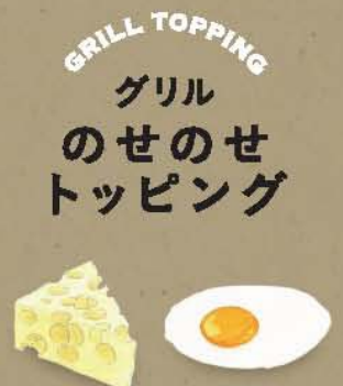
GRILL TOPPING グリルのせのせトッピング チーズ 目玉焼き ¥100 ¥80